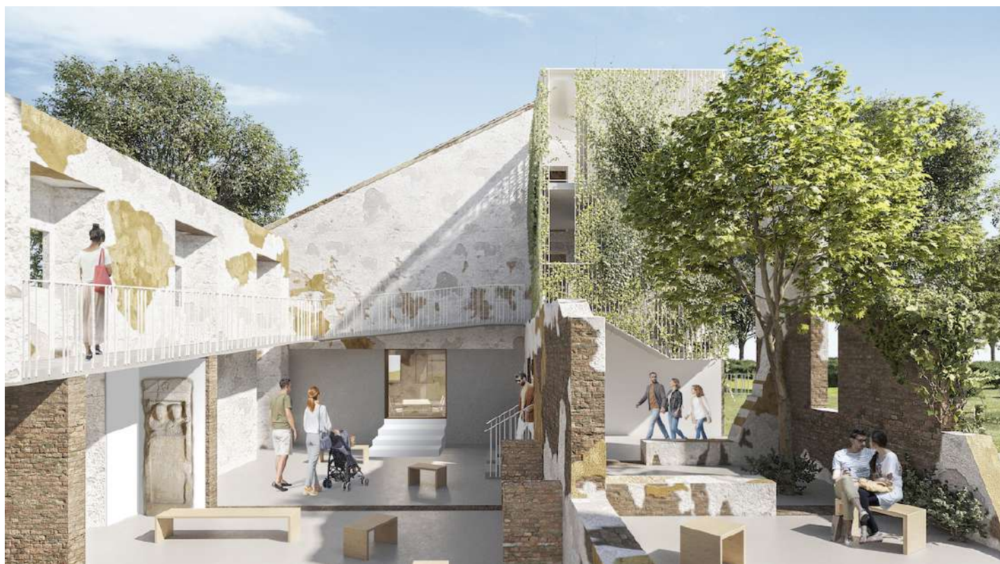
Parco Archeologico Laus Pompeia, Lodi Vecchio

RIQUALIFICAZIONE ( HTTPS://WWW.ARTRIBUNE.COM/TAG/RIQUALIFICAZIONE/ )