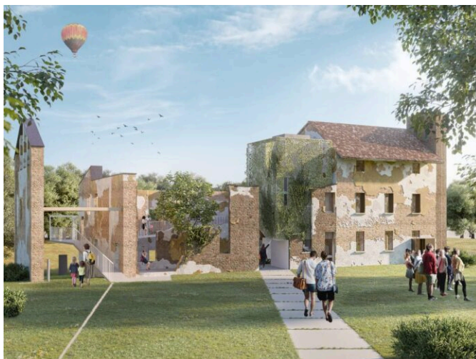
Rendering progetto Laus Pompeia

Gli esempi più recenti in questa direzione sono quello del Parco archeologico di Laus Pompeia , in ambito urbanistico-paesaggistico, e quello per Fratelli Carli in ambito commerciale.